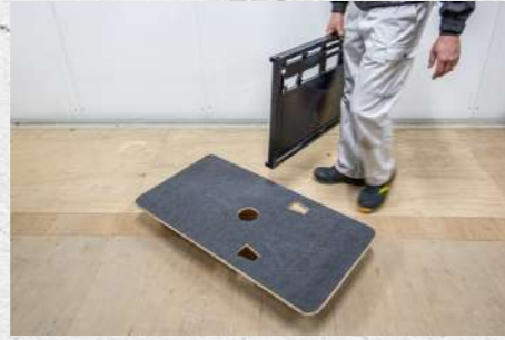
② 平板運搬具を持ってくる