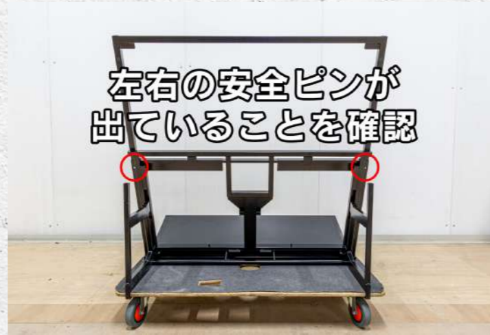
④ 背板が固定できているか