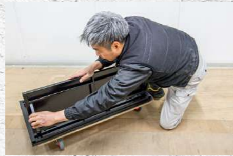
㉖ 逆側も同様に取り付ける