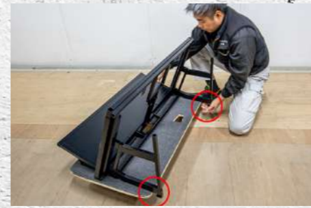
㉒ 組立後、印の箇所を台車に引っ掛けて、最後まで押し込む