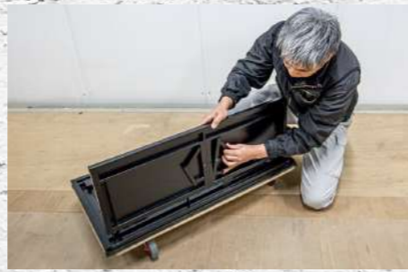
㉑ 転倒防止脚のピンを押して外す