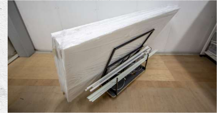
積載例② プラスチックベニヤ×5t×(≒50枚)+小物