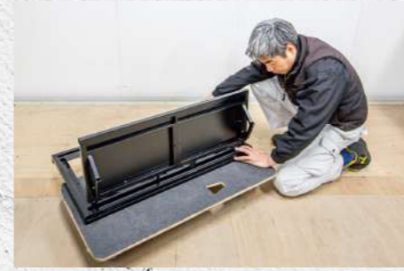
④ 転倒防止脚を立てれる位置まで平板運搬具をスライド