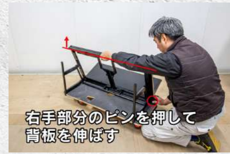
㉔ 上記手順で背板フレームを引き伸ばす