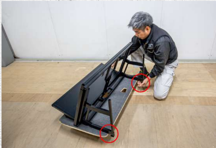
③ 運搬具がズレないようにツメがはまっているか