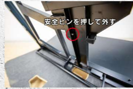
⑯ フレームの外し方参照