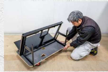
㉓ 正しい位置まで引っかった状態