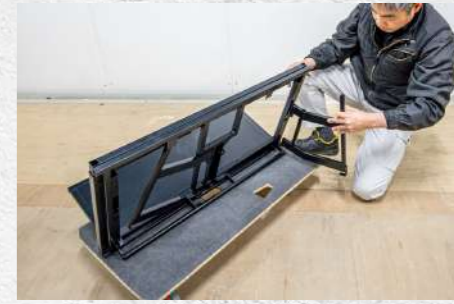
⑫ 外した端の装着位置に取り付ける