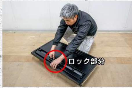
⑨ 上部中央にある積載板のロックを確認