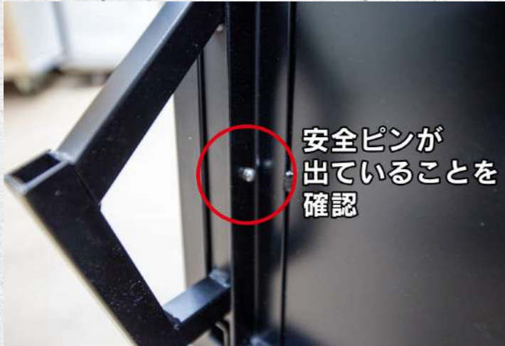
① 転倒防止脚が固定できているか