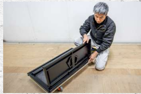
⑳ 差し込んだ状態(背面が見やすいように台車を回転させています)