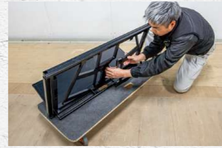
⑪ バックフレームを取り外す