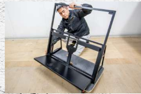
㉘ カチッと音がするまで引き伸ばす