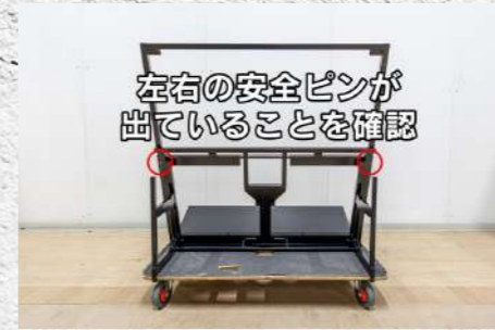
㉙ 左右のピンが出ていることを必ず確認