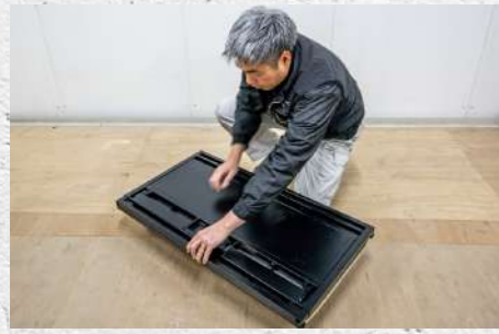
⑬ 上にスライドして積載板のロックを解除