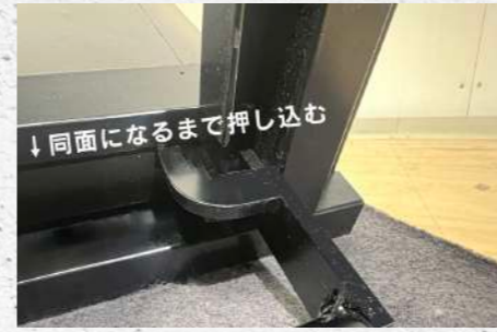
⑩ バックパネルと積載板が写真のように同面になるまで差し込む