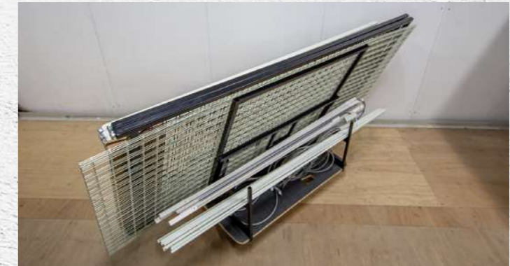
積載例④ スチールフレーム+小物