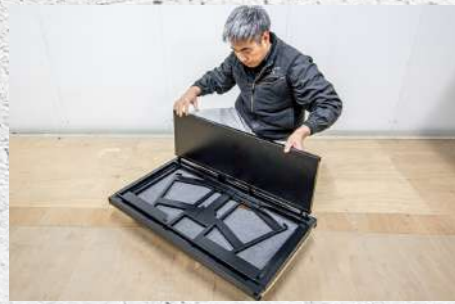
⑲ 縦にまっすぐ差し込む