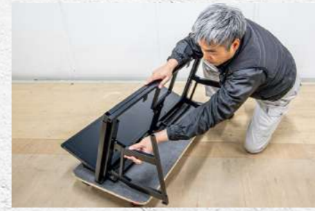
⑰ 逆側も同様に取り付ける