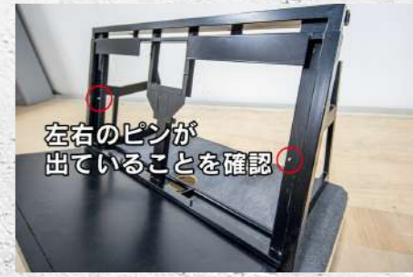
⑱ 装着後、前面の左右のピンが出ていることを必ず確認