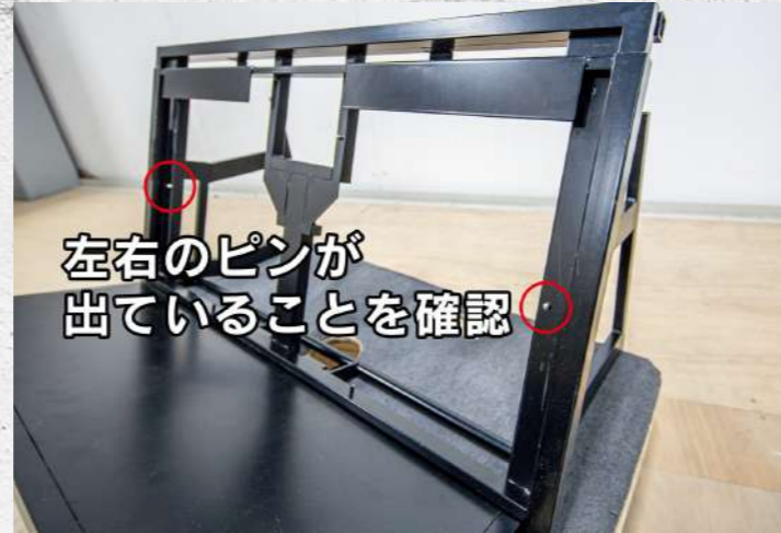
② バックフレームがきちんと固定できているか