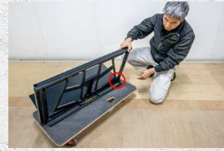
⑥ 問題なく自立することを確認後、赤丸部分をチェック