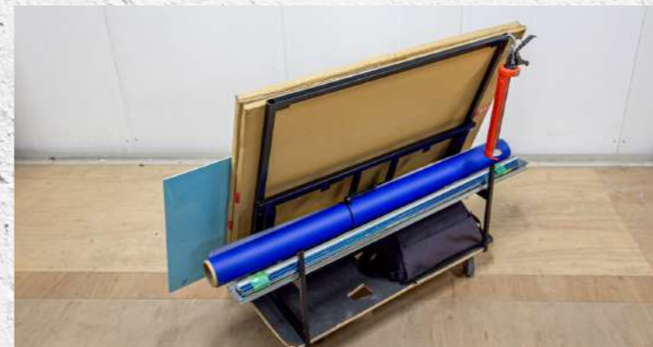
積載例⑤ アルポリ+シート+工具