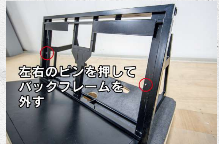
② バックフレームの収納