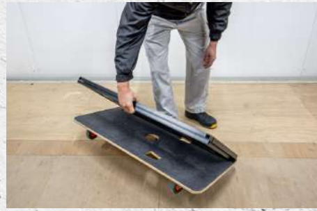
⑦ 平台車の上に寝かせる