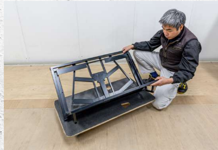
③ バックフレームを収納して上下反転