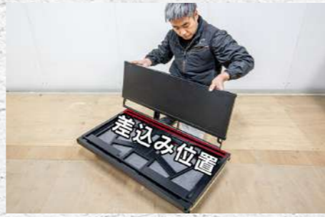
⑮ 赤線の位置に積載板を合わせる