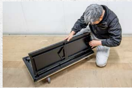
㉕ 外した端の装着部分に取り付ける