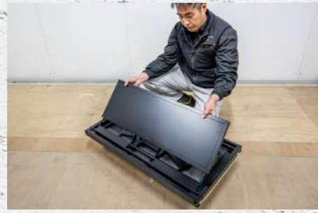
⑭ 積載板を上を持ち上げる