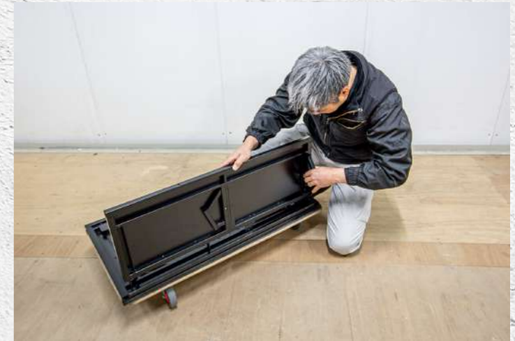
④ 転倒防止脚を収納