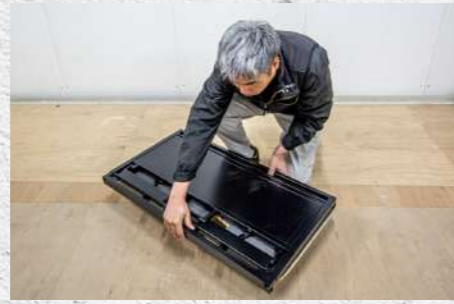
⑧ 上下左右の寝かせ位置を調整する