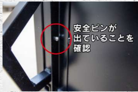
㉗ 装着時に安全ピンが出ていることを必ず確認(ピンが出ていないと脚が外れて大変危険です)